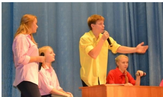
Первокурсники готовились морально...

26 сентября состоялся главный праздник для студентов нового набора «ПОСВЯЩЕНИЕ В СТУДЕНТЫ-2013!». В тёплой дружеской обстановке прошла церемония посвящения нового набора в студенты ИГРТ.